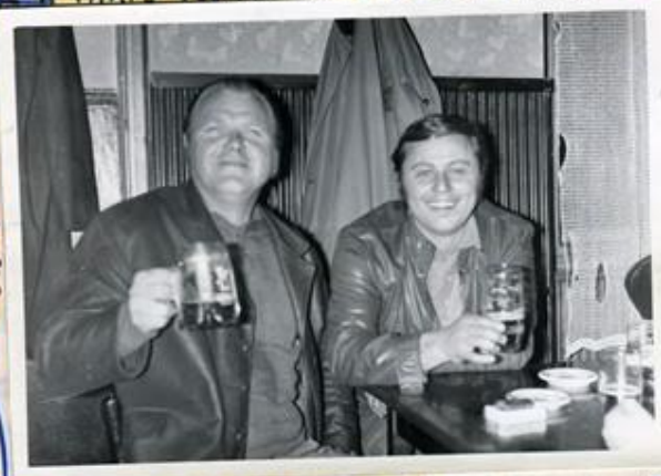
SCHNELLER A PROKAZKA JAKO CAPITÁN JAKO HRÁČ P. 2.