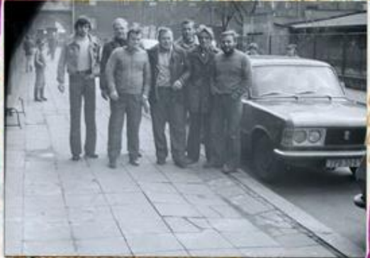
TUMA, HODAS, PRAMENKA

TAHLE SMEČKA SI ZAJELA DO ÚSTI PRO NÁLEP. POKŮZE FANDA MĚŠTVA OJA HRABEK BYL STASTEN